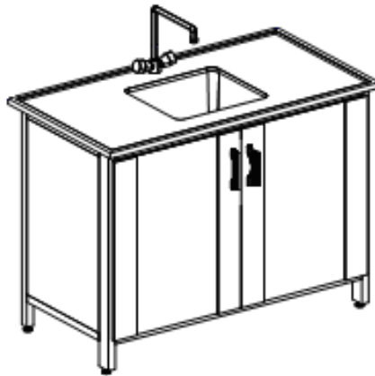
ЛАБ-PRO МО 120.65.90 VI 1200*650*900мм в базовой комплектации